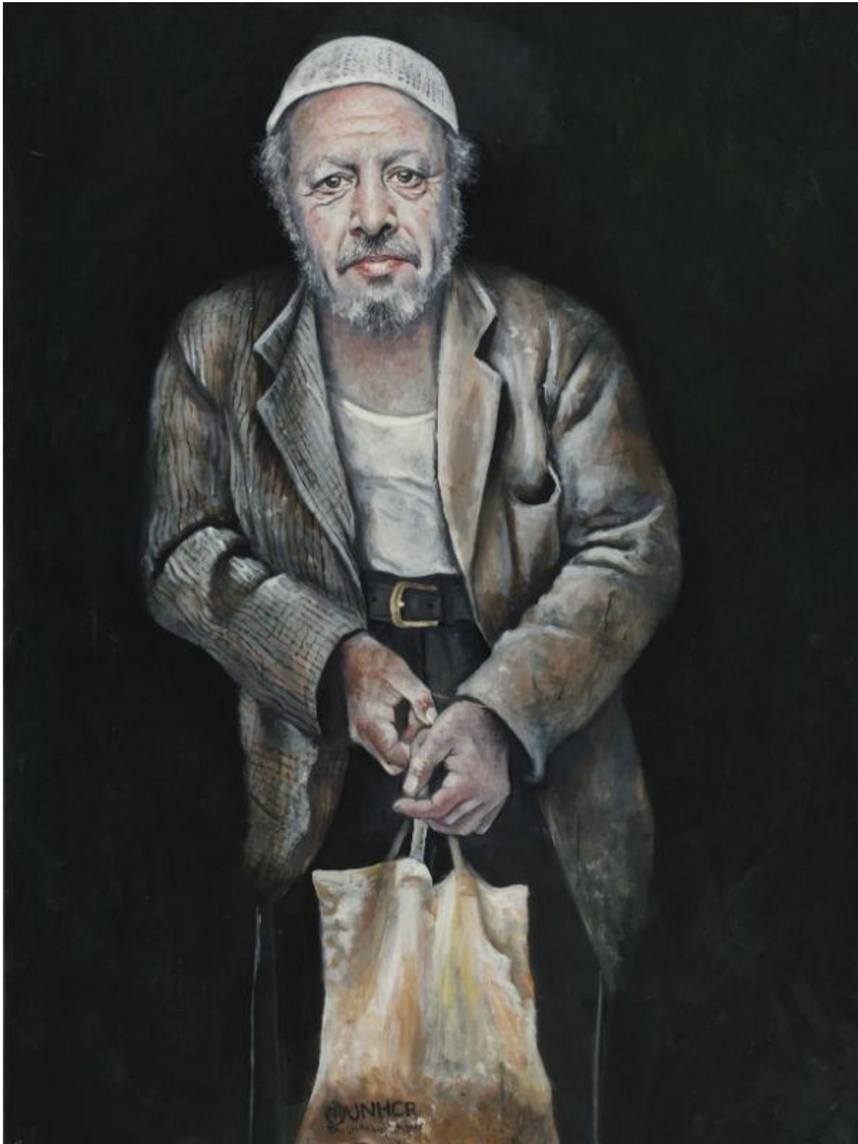
رجب طیب اردوغان، رئیس جمهوری ترکیه