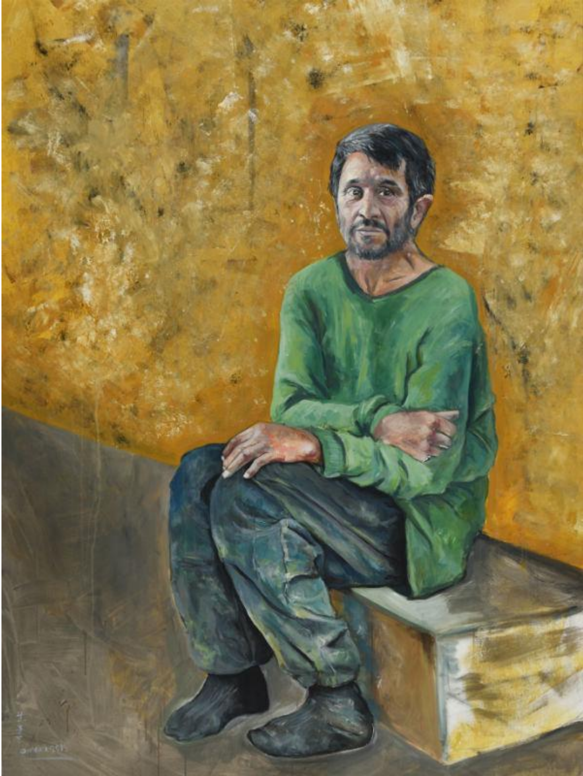
محمود احمدی نژاد، رئیس جمهوری سابق ایران