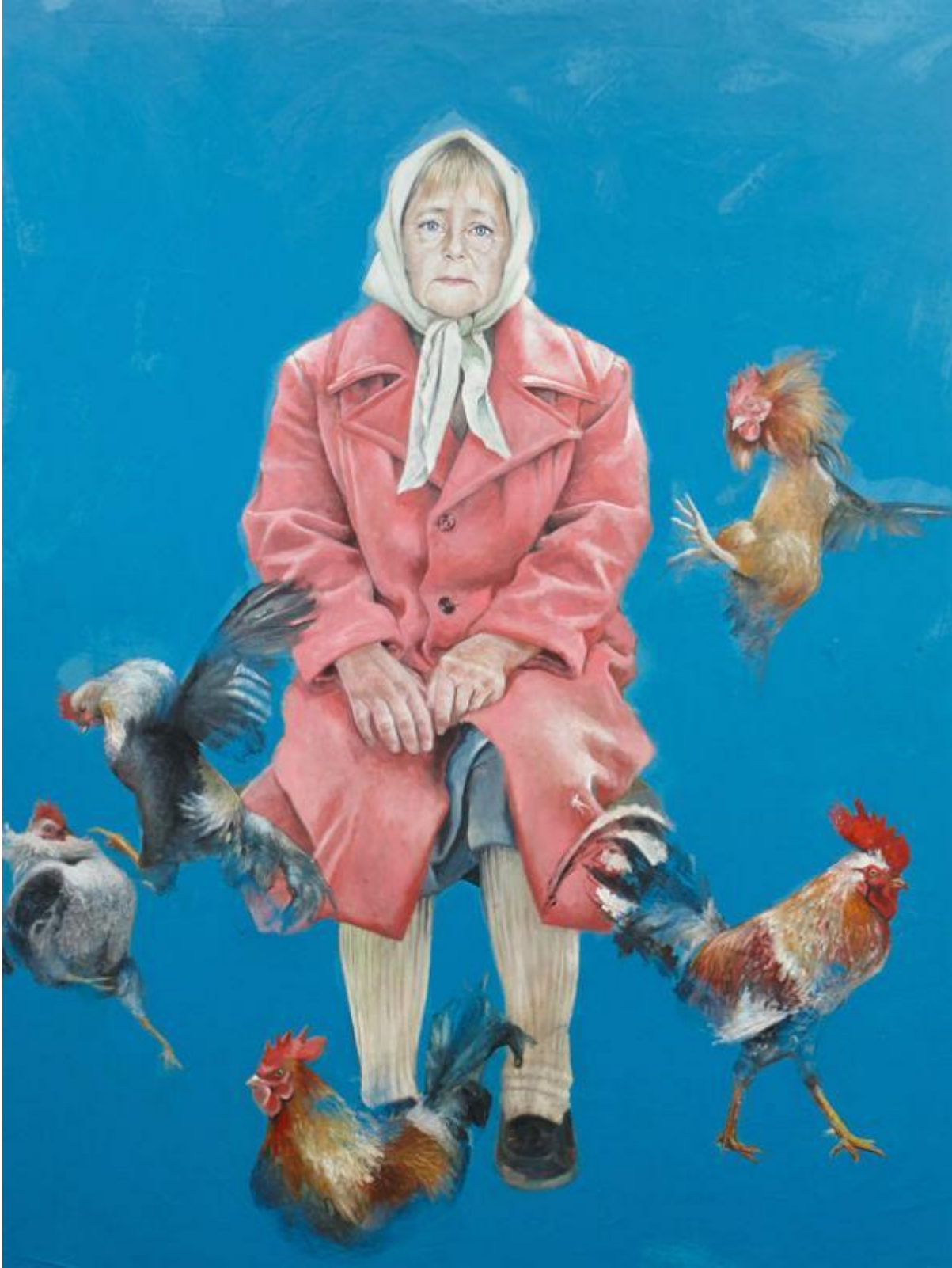
آنگلا مرکل، صدراعظم آلمان