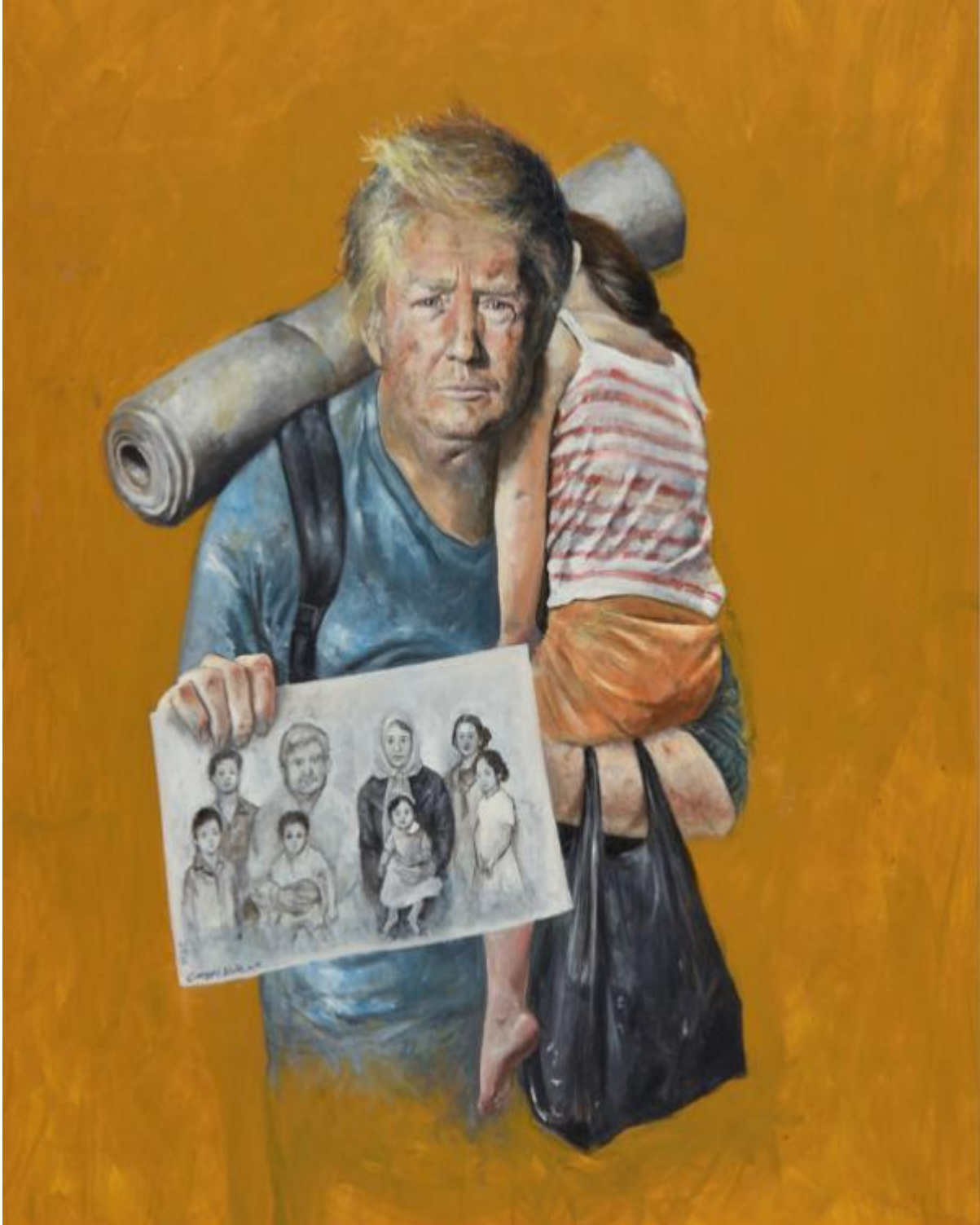
دونالد ترامپ، رئیس جمهوری آمریکا