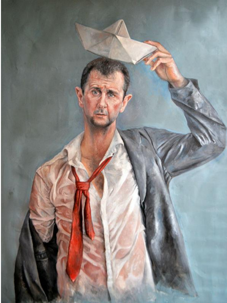
بشار اسد، رئیس جمهوری سوریه