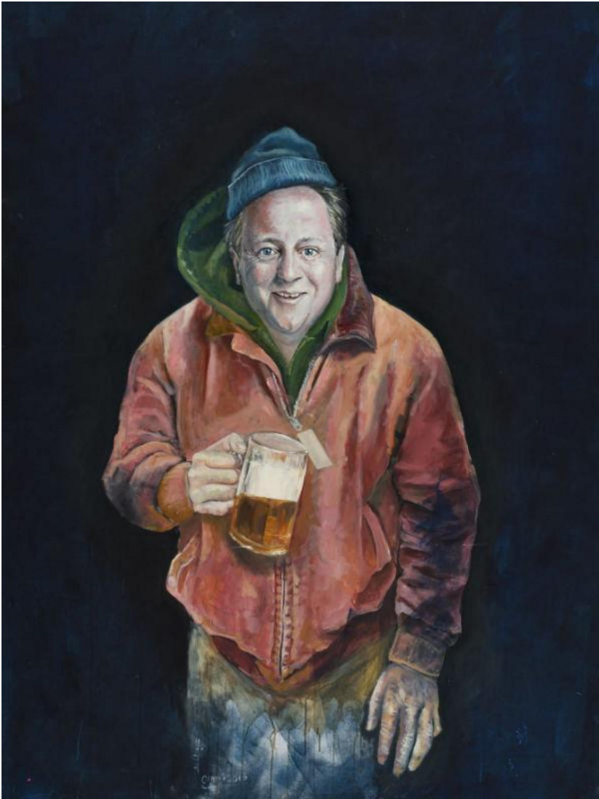
دیوید کامرون، نخست وزیر سابق بریتانیا