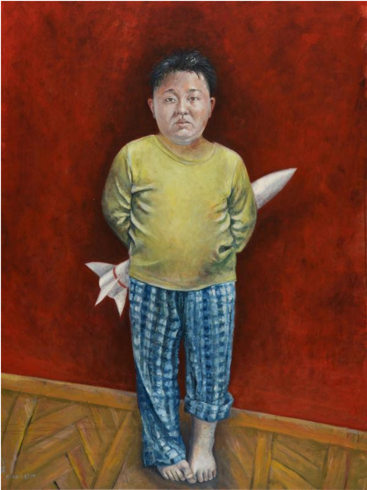
کیم جونگ اون، رهبر کره شمالی