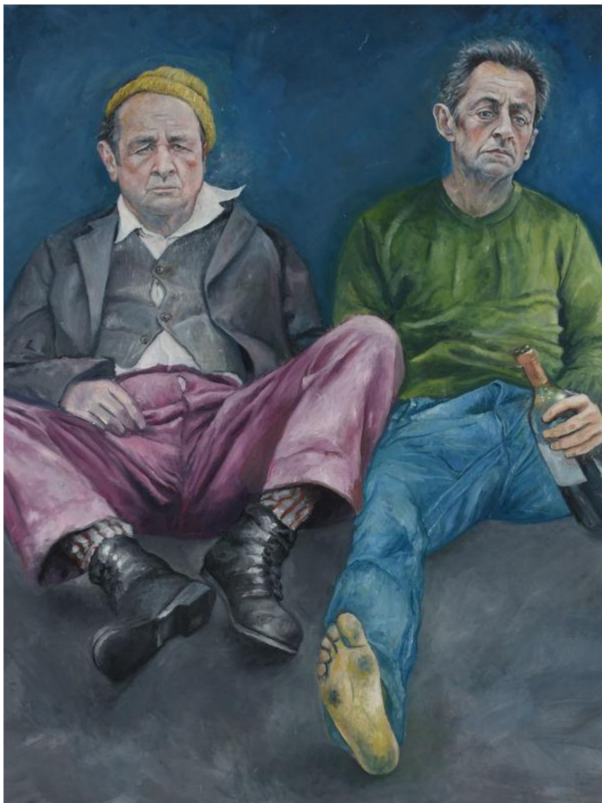
فرانسوا اولاند و نیکولا سارکوزی، روسای جمهور پیشین فرانسه