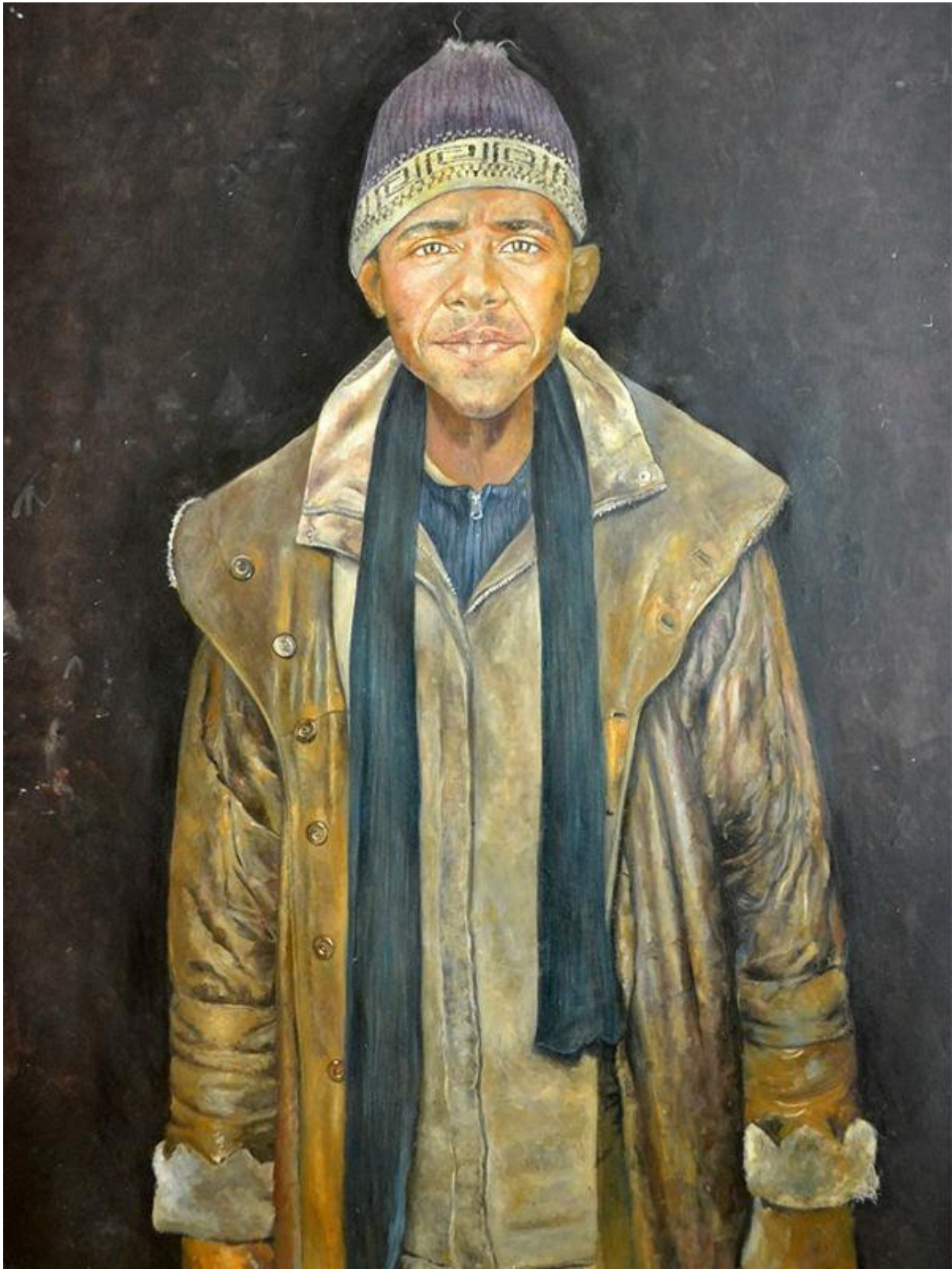
باراک اوباما، رئیس جمهوری سابق آمریکا