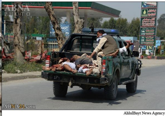
AhluBayt News Agency