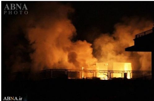
AhluBayt News Agency